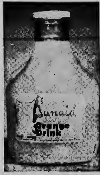
SUNAIID tambe pa jam, gilea y juice

cabez dilanti e gran favorito Jet. Na principio di e careda ta Cravate a tuma e delantera cu Pinkerton su tras sigui pa Eofin, Jet, Norquince, Great Tide y Español. Pinkerton a trata di pasa Cravate pero Jet y Español tambe a bai padilanti y cabez cu cabez den e yega e meta. Fotografia a muestra Español como e ganador. Norquince cu a corre un bon careda a drenta di tres. Un ora pa otro e cabai aki cu a corre eaba den agrupacion mas fuerte ta bai tin un victoria inespera. Ojo cu ne.